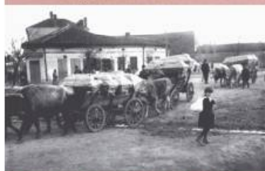
Сахрана мртвих у Мачви, 1914.