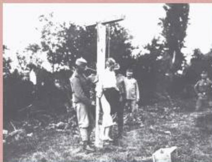
Аустријски војници вешају мајку четворо деце у Јевремовцу код Шапца