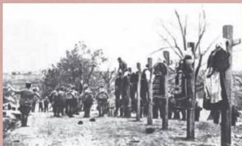
Аустро-угарски војници вешају сељанке у Мачви, август 1914.

Аустро-угарски генерал Хорштајн, наредба пред напад на Србију