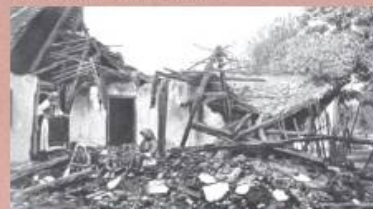
Жене и деца на згаришту куће у Мачви за време аустријске окупације Србије 1914.

Само по забелешкама др Арчибалда Рајса, током борби на Церу, у селима Јадра, Рађевине, Поцерине и Мачве и варошима Шапцу, Лозници, Крупњу и Љубовији стрељано је или обешено, одведено у ропство или нестало 3.340 цивилних лица. Разорено је, спаљено или оштећено 3.926 кућа, упропашћене многе зграде, погажена летина, заклана или отерана стока. Они који су били у бежанији, по повратку, затекли су згаришта или опустошене домове, празне торове, разваљене ограде.