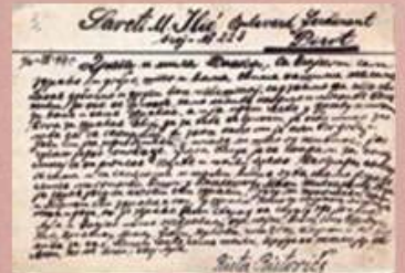
Полеђина дописне карте

Почетком двадесетог века писма су била најмасовнији начин комуникације међу људима. У писмима су уткане речи које сведоче о интими онога ко пише - емоцијама, надањима, свакодневном животу. У периоду Великог рата посебно су биле популарне фотографије-дописнице, са једне стране фотографија пошљаоца или породице, а са друге текст. За све људе који се налазе у тешким животним ситуацијама, као што је рат, писање писма смирује, а примање даје осећај заједништва. Писма се могу чувати и више пута ишчитавати. Није редак случај да потомство чува писма својих предака и тиме гаји сећање на њих и сопствене корене.