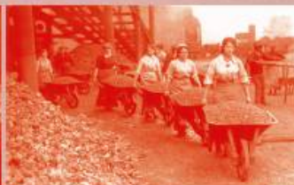
Британке на физичким пословима