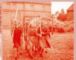
На француским пољима

На крају рата премијер Британије Дејвид Лојд Џорџ је изјавио: "Било би потпуно немогуће успешно водити рат да није било вештине, жара и ентузијазма жена и успеха индустрије у којој су оне радиле".