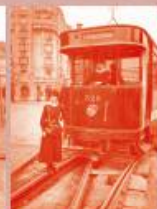
Кондуктерке у Француској