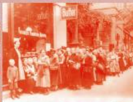
Жене у Немачкој у реду за хлеб